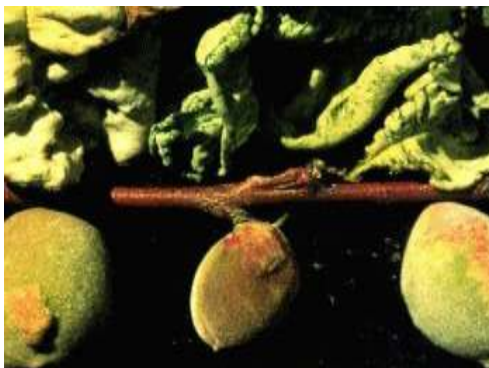
Εικόνα 2 Συμπτώματα εξώασκου σε φύλλα και καρπούς αμυγδαλιάς

ΔΙΑΠΙΣΤΩΣΕΙΣ: Από παρατηρήσεις στην ύπαιθρο και στο εργαστήριο φυτοπροστασίας της Υπηρεσίας μας διαπιστώθηκε ότι αυτή την εποχή η δραστηριότητα του παθογόνου παραμένει ενεργός πάνω στους οφθαλμούς, τους βλαστούς και κλάδους της αμυγδαλιάς.