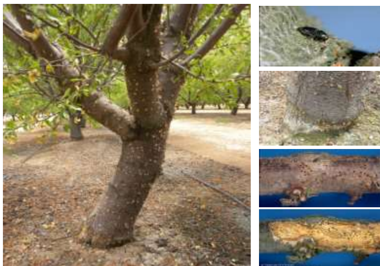
Εικόνα 3 Προσβεβλημένο δένδρο αμυγδαλιάς από σκολύτη.