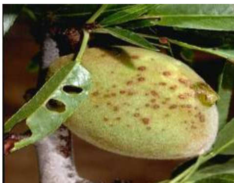
Εικόνα 1 Συμπτώματα κορύνεου σε φύλλα (τρύπες από σκάγια), βλαστό και καρπό

ΣΥΣΤΑΣΕΙΣ: Συνιστώνται ψεκασμοί για τις περιοχές που τα δένδρα βρίσκονται στο τελικό στάδιο της διόγκωσης των οφθαλμών και επανάληψή μετά την πτώση των πετάλων, με κατάλληλα και εγκεκριμένα φυτοπροστατευτικά προϊόντα όπως: captan , copper oxychloride , calcium copper sulfate , copper hydroxide , folpet , κ.α.